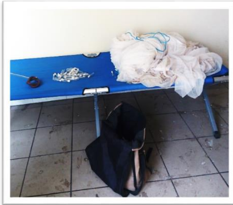
Figure 1 : Une partie du matériel de capture des moustiques