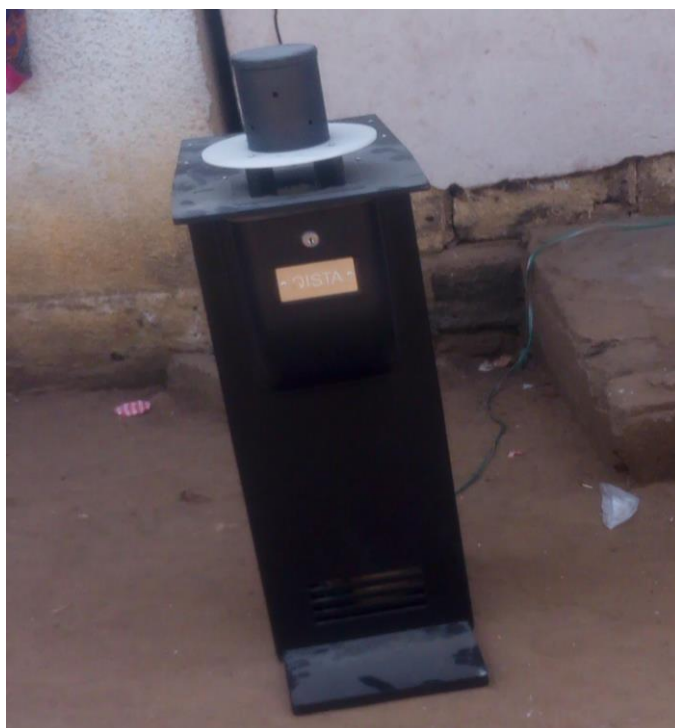
Figure 3 : Borne anti-moustique QISTA installée à l'extérieur d'une habitation à Dabou